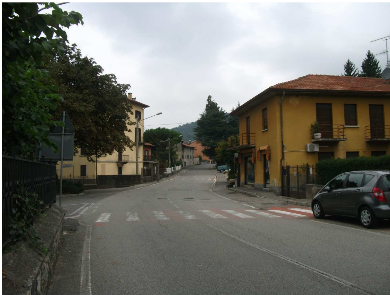
Foto Strada principale Comune Saltrio