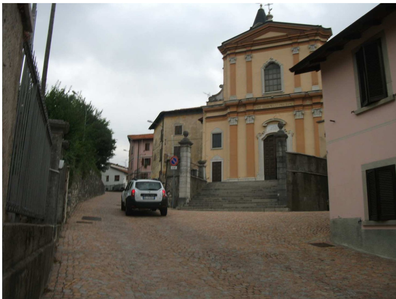
Foto Chiesa Parrocchiale Comune Saltrio