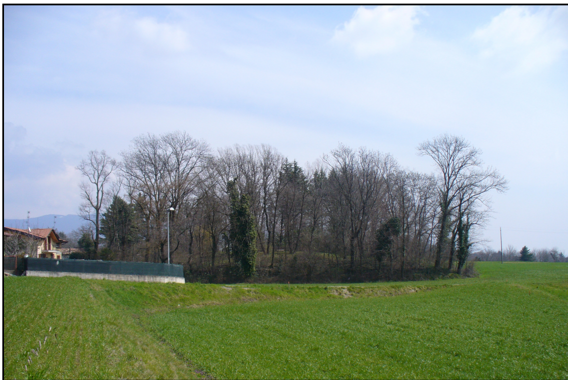
PRIMA – VISTA DA OVEST