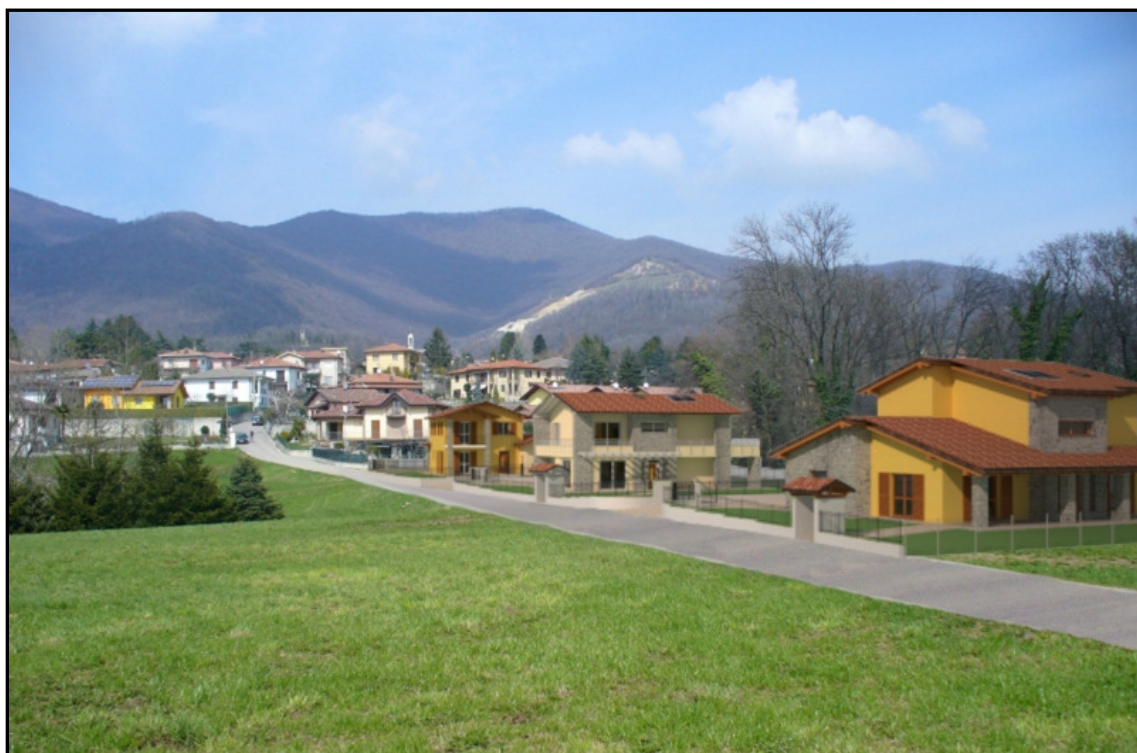
DOPO – VISTA DA SUD OVEST