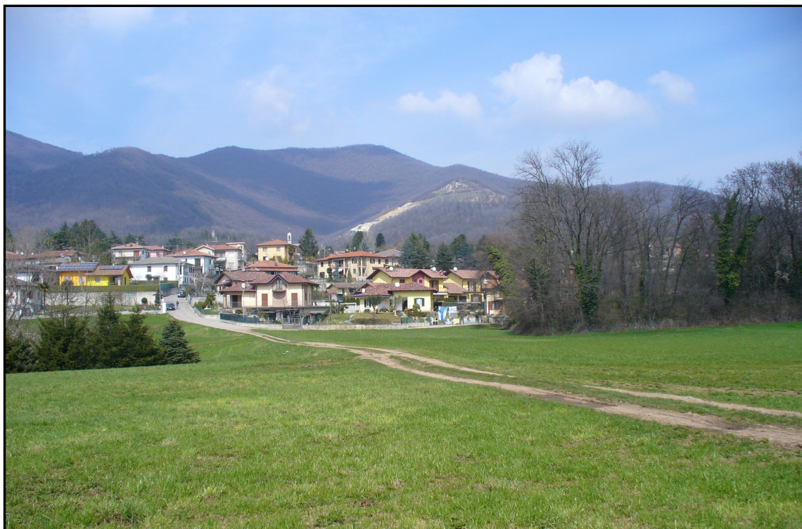
PRIMA – VISTA DA SUD OVEST