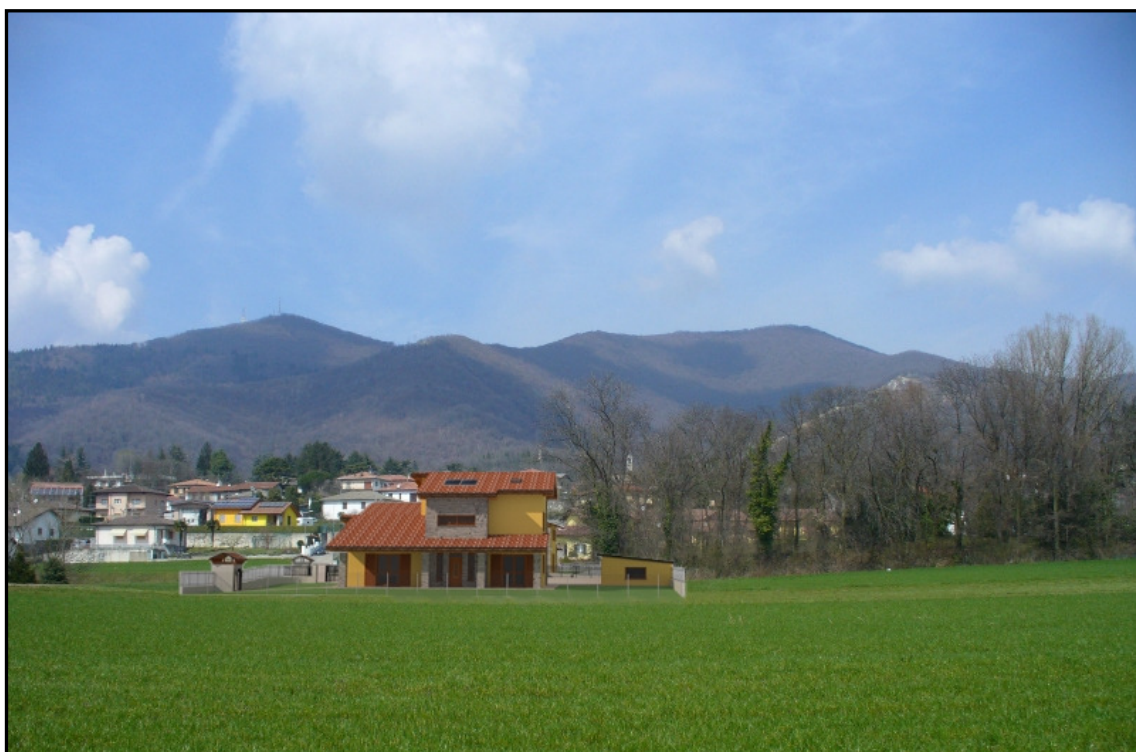
DOPO – VISTA DA SUD EST