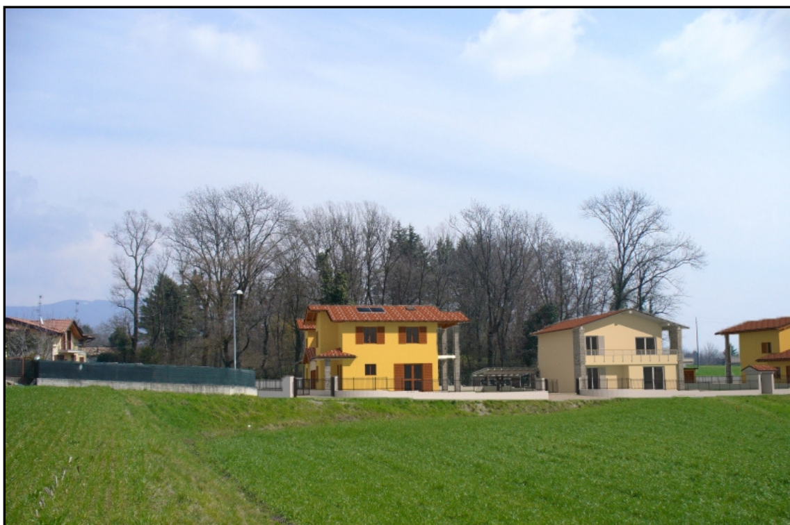
DOPO – VISTA DA OVEST