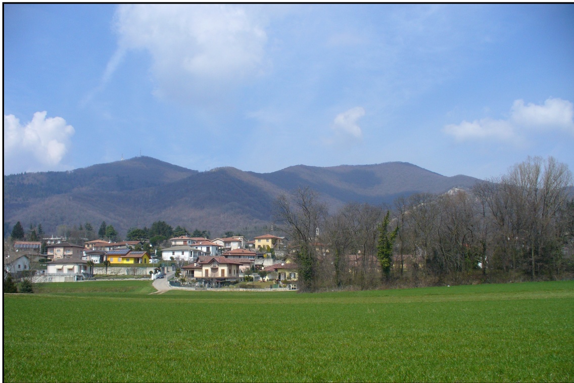
PRIMA – VISTA DA SUD EST