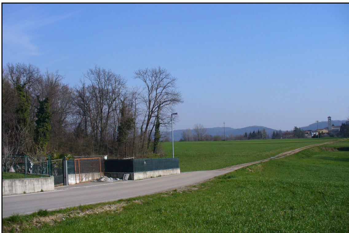
PRIMA – VISTA DA NORD OVEST