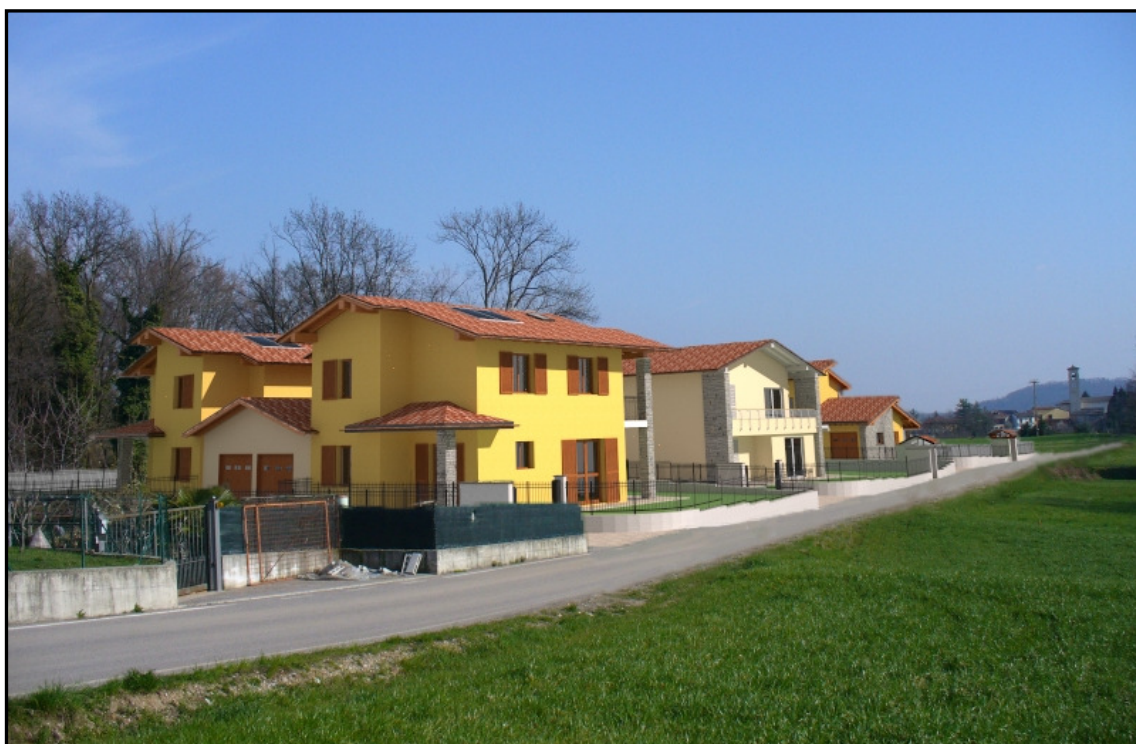
DOPO – VISTA DA NORD OVEST